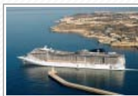
Su MSC splendida la "Crociera dei singles"

MondoRaro cerca nuovi collaboratori o collaboratrici sulla città di Roma per la sezione dedicata alle recensioni cinematografiche. Se sei appassionato/a dell'argomento e ti piace scrivere recensioni invia una mail a redazione con i tuoi dati (nome, cognome, cellulare, titolo di studio). Ci teniamo a precisare che la collaborazione, purtroppo, non è retribuita , però il/lo collaboratore/ice parteciperà alle Proiezione Stampa in anteprima dei film di prossima uscita, con possibilità di intervistare, negli eventi dove è previsto, il regista e/o il cast del film.