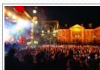
Belfast: città della musica... e di Van Morrison